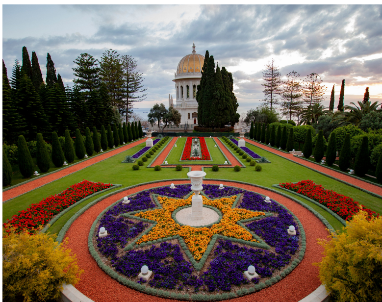
Del av trädgården runt Bábs gravhelgedom

Báb kallade mänskligheten till att omfatta en ny vision som fullt ut tar hänsyn till de krafter och förmågor som frigörs i samhället genom vetenskap och näringsliv, liksom förändringar i de politiska och ekonomiska systemen. Hans lära förmedlade en insikt om mänsklighetens bestämelse på jorden som mötte förhoppningarna och strävandena hos dem som såg artonhundratalet som början på en “modern tidsålder” med dess särskilda anda och dynamik.