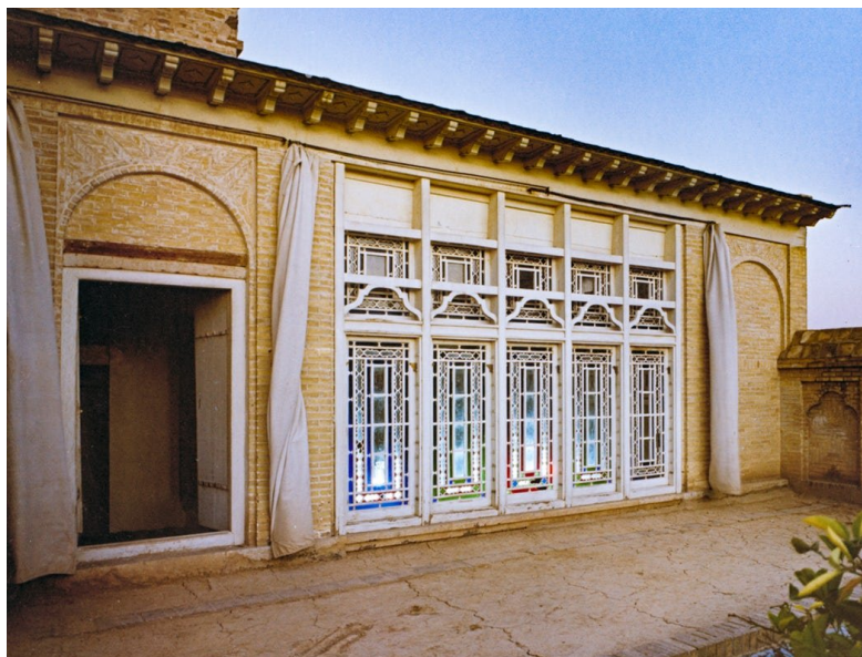
Den övre delen av Bábs hus i Shíráz, Iran

Báb var en budbärare från Gud, den senaste i en följd av gudomliga lärare under mänsklighetens historia, vilka inkluderar Abraham, Krishna, Zarathustra, Moses, Buddha, Jesus och Muhammad. Báb framträdde vid en tidpunkt i historien då världens folk och kulturer möttes som aldrig förr. Artonhundratalet uppvisade en rad förändringar på de ekonomiska, politiska, vetenskapliga och kulturella områdena som var så genomgripande att en framstående historiker har beskrivit det århundradet som “omvandlandet av världen”.