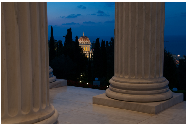
Bábs gravhelgedom i Haifa, Israel

Bábs lära uppmanade till renhet i hjärta och handling som går utöver enbart ord och tro. Han vägledde sina anhängare till ett mönster av bön, meditation, självdisciplin, till altruism och social solidaritet. Han skrev: