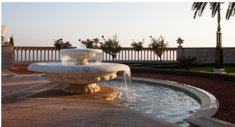
En av de lägre terrasserna vid Bábs gravhelgedom

Dessa två högtider är nära sammanlänkade. Centralt för Bábs liv och budskap var det nära förestående framträdandet av ännu en gudomlig budbärare: Bahá'u'lláh. Varje år firas Bábs och Bahá'u'lláhs födelsedagar som tvillinghögtider, eftersom de enligt den tidens persiska kalender inträffade omedelbart efter varandra. Deras födelsedagar firas i år den 29:e och 30:e oktober.