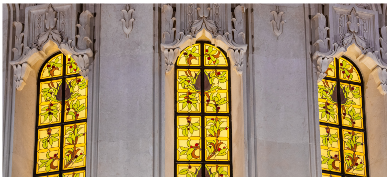
Lansettfönster på Bábs gravhelgedom

Det kommer att behövas en växande medvetenhet om mänsklighetens enhet för att skapa enighet i tanke och handling för att styra utmaningarna och övervinna problemen framför oss. Men det råder inget tvivel om att Báb och Bahá'u'lláh förutsåg en framtid för mänskligheten långt mera strålande än någonsin tidigare, en värld i enighet och mångfald där mänskliga förågor som förstånd och vision, kreativitet och kärlek kommer att blomstra.