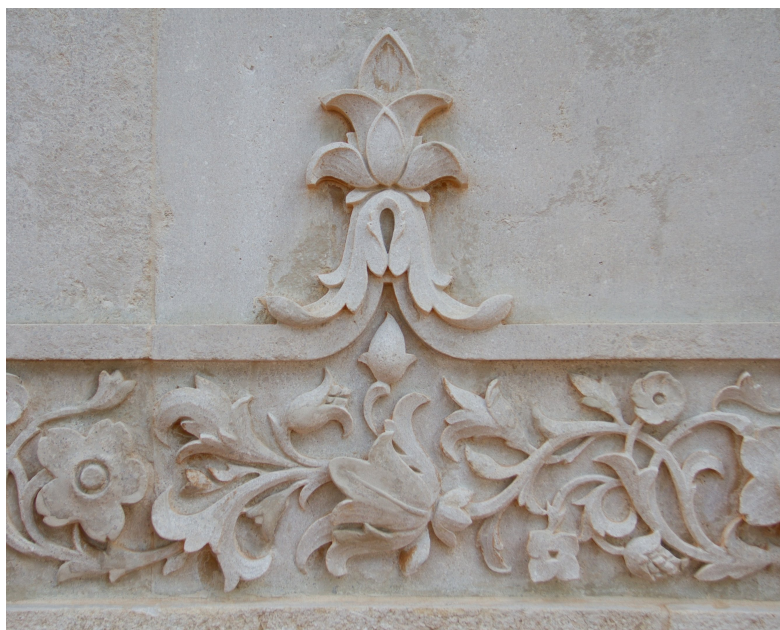
Utsmyckning på Bábs gravhelgedom

Han höjde kvinnornas sociala ställning, mäktigt representerat av en av hans främsta efterföljare, Táhirih, som har kallats “ledaren för frigörelsen av Orientens kvinnor”. Báb höjde sig över fientlighet mellan religioner och förberedde människosläktets framtida enhet på ett sätt som motsvarar drömmarna och idealen hos filosofer, poeter och tidigare gudsprofeter i alla tider.