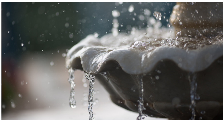
Detalj av fontän

drog bort efter salvan kunde man inte se Báb.... Kulorna hade trasat sönder repen med vilka han var bunden”. Báb hittades i sin cell dikterande de sista instruktionerna till sin sekreterare. En annan trupp soldater ersatte den första och fullföljde orden.