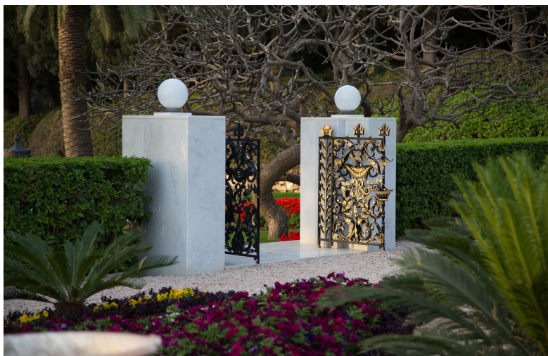
Grinden till Bábs gravhelgedom

Snart därefter, år 1850, beordrade shahens premiärminister Bábs avrättning. Den 9 juli hängdes Báb upp vid en militär-anläggning tillsammans med en ung anhängare. En bataljon med 750 soldater avfyrade sina gevär men trots detta var Báb och hans följeslagare fortfarande oskadda. Som ett brittiskt diplomatiskt telegram rapporterade: “När röken och dammet